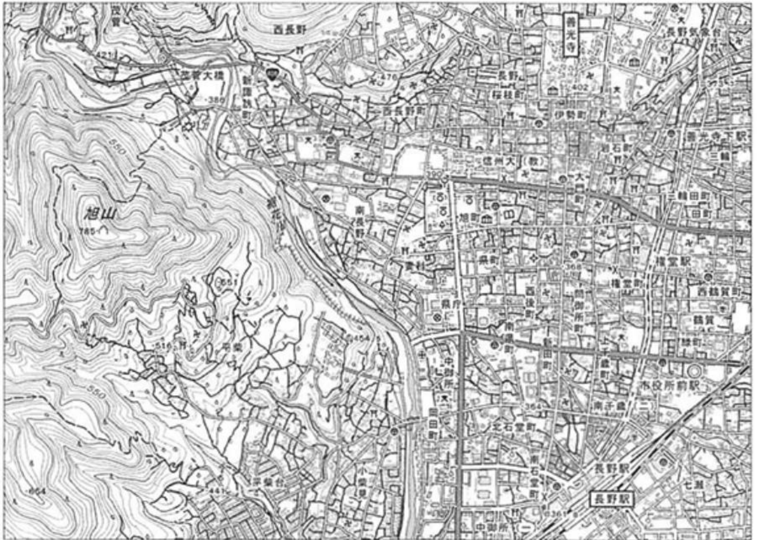
(2万5千分の1の地形図 2015(平成27)年測量 国土地理院作成 一部改変)