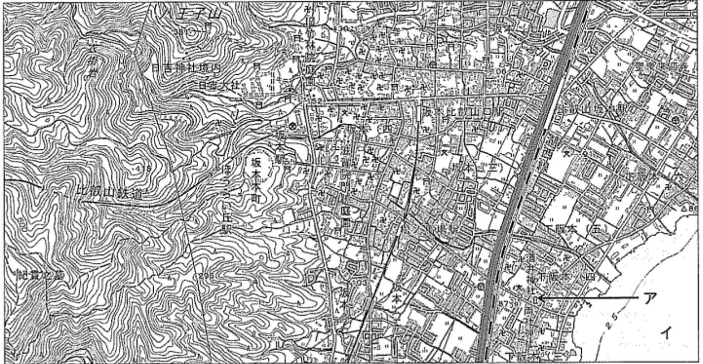
〔2万5千分の1の電子地形図 国土地理院作成（令和2年調製）〕一部改変

地形図 大津市は、滋賀県の県庁所在地です。次の地形図は、大津市の一部を示したものです。